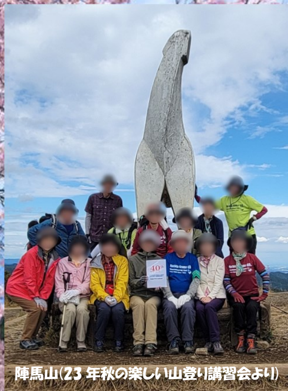
陣馬山(23年秋の楽しい山登り講習会より)